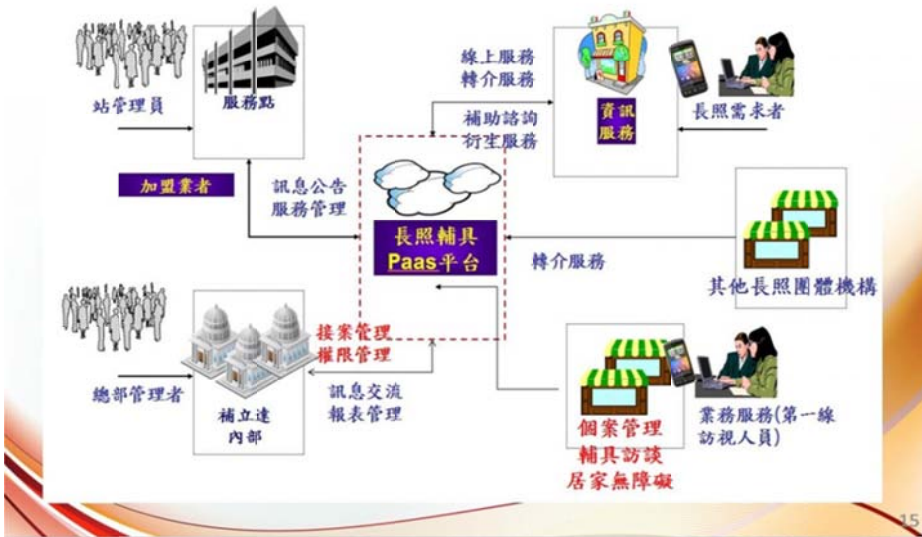
圖 5 補立達長照平台架構及功能