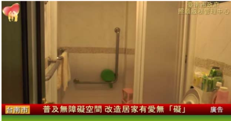
圖 4 普及無障礙空間 改造居家有愛無「礙」